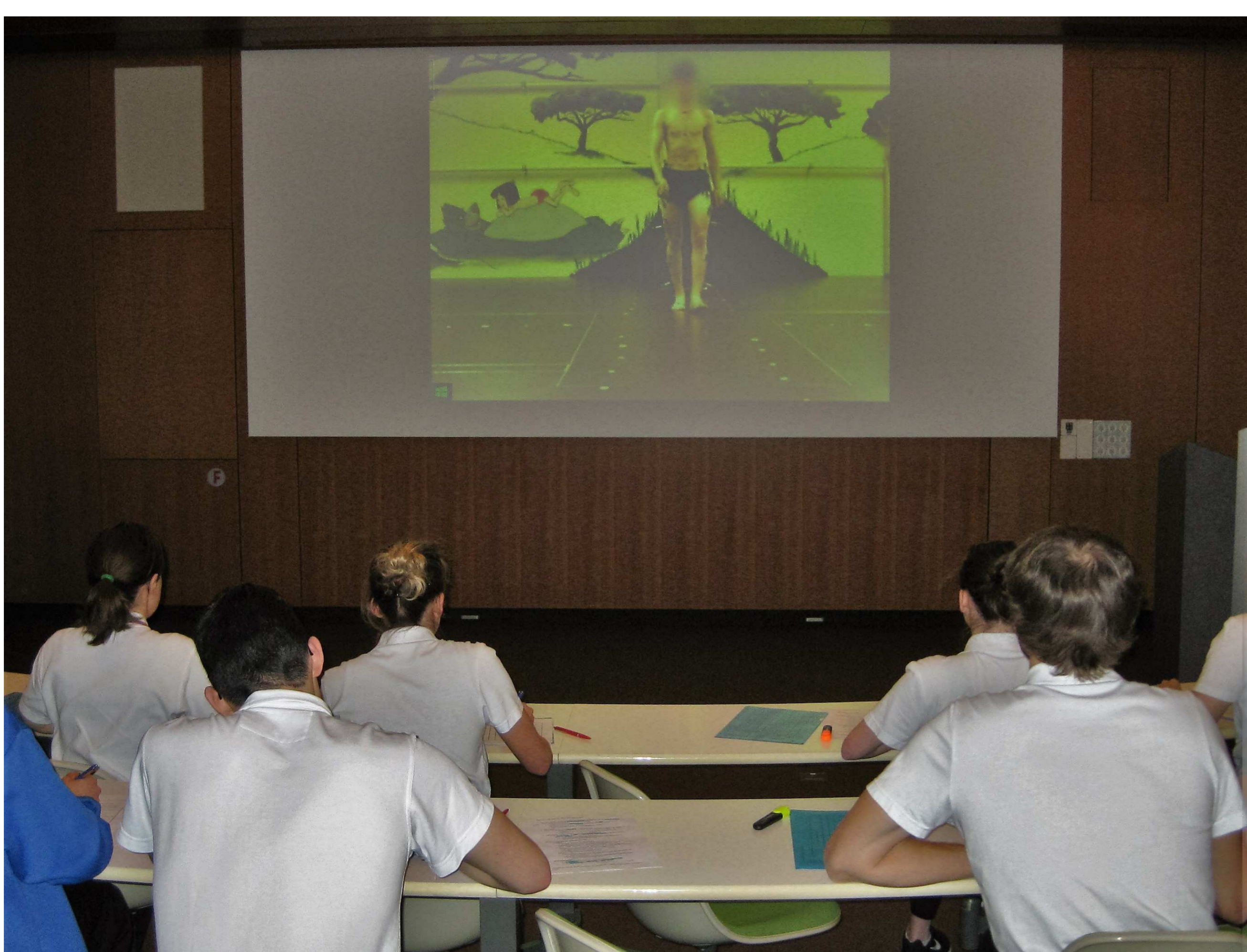
Abb. 1: Gruppe beim Rating der Videos

Das Ziel dieser Arbeit ist, anhand von Gangvideos die Interrater-Reliabilität von Raterinnen und Ratern verschiedener, nach Berufserfahrung eingeteilter Gruppen bei diesem Vorgehen zu untersuchen.